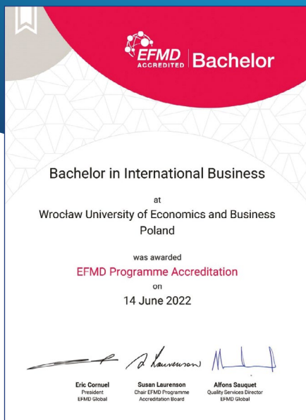
Fot. 10. Certyfikat akredytacji EFMD dla studiów licencjackich na kierunku International Business