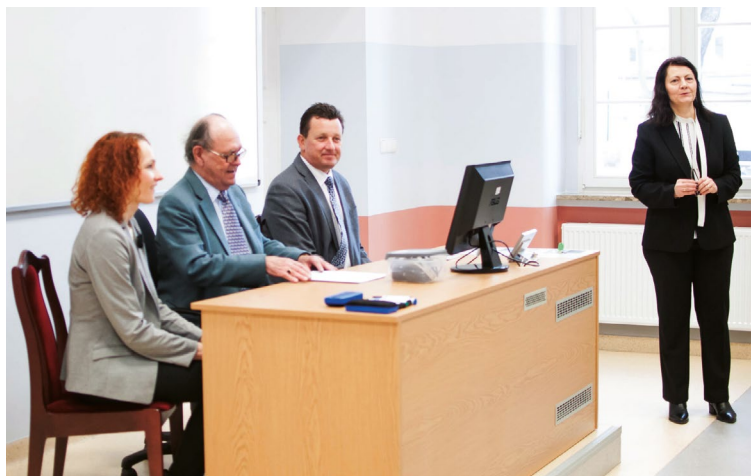
Fot. 1. Eksperci CEEMAN podczas wizyty na Uniwersytecie Ekonomicznym we Wrocławiu w styczniu 2017 r.

cenieni na rynku pracy – zarówno przez pracodawców lokalnych i regionalnych, jak i przez firmy międzynarodowe. Ponadto w opinii ekspertów CEEMAN nasz Uniwersytet cechuje się silną kulturą badawczą oraz godnym podziwu, znaczącym dobrem i zaangażowaniem naukowo-badawczym pracowników. Docenione zostały także znaczne postępy w kierunku internacjonalizacji w wielu aspektach działalności Uniwersytetu, nakierowane na ambitne, a jednocześnie realistyczne plany dalszego wzmacniania reputacji międzynarodowej.