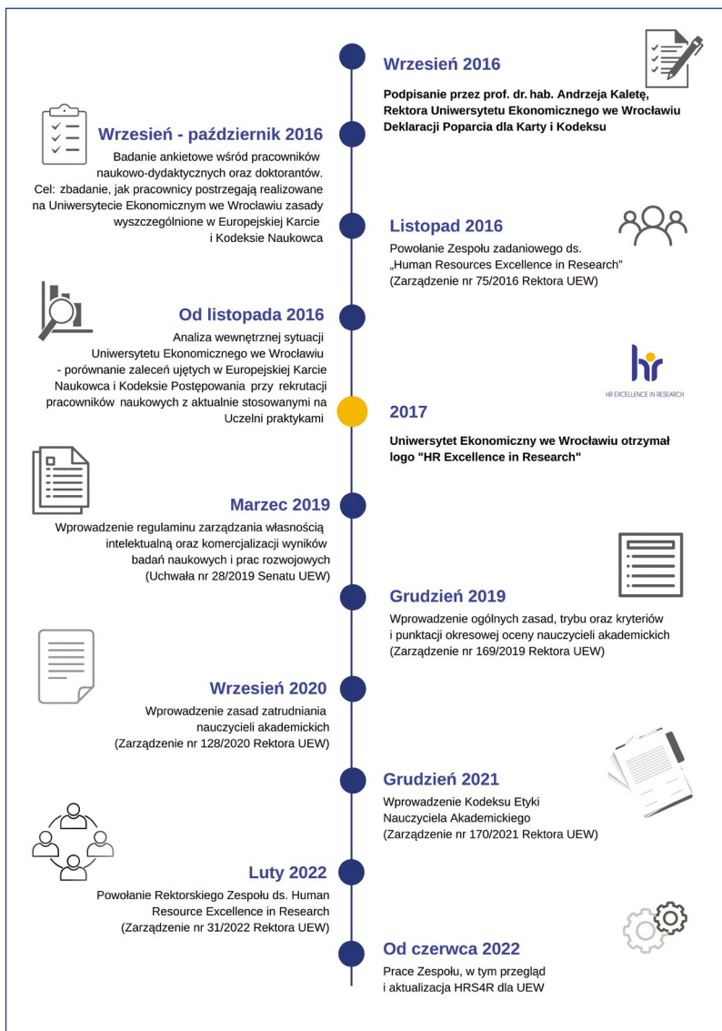
Fot. 14. Działania Uniwersytetu Ekonomicznego we Wrocławiu prowadzące do uzyskania wyróżnienia HR Excellence in Research – kalendarium