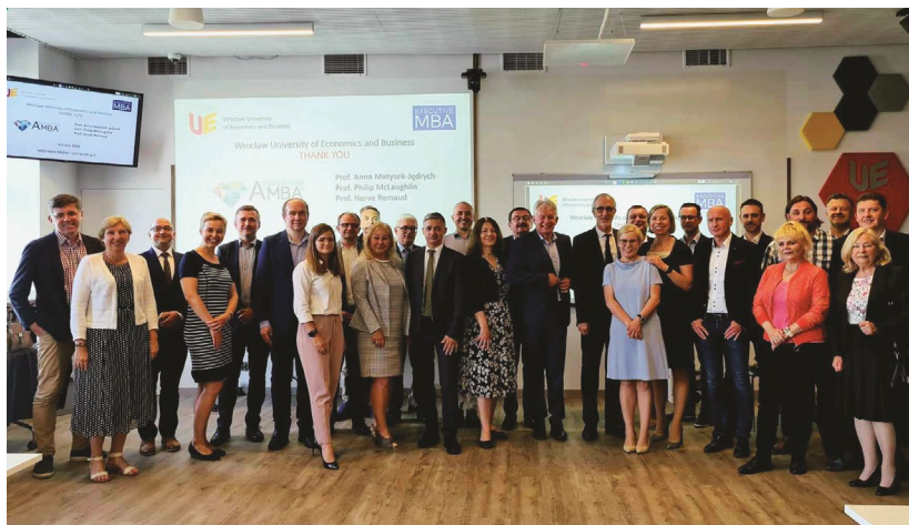
Fot. 5. Spotkanie z Komisją Akredytującą AMBA w 2022 r.

Program Executive MBA prowadzony przez Uniwersytet Ekonomiczny we Wrocławiu otrzymał Certyfikat Akredytacji AMBA we wrześniu 2019 r. Jest to najstarsza i najbardziej prestiżowa międzynarodowa akredytacja przyznawana przez stowarzyszenie MBA. Akredytacja AMBA to globalny standard dla wszystkich programów MBA, DBA i magisterskich. Stowarzyszenie akredytuje obecnie programy zaledwie 2% szkół biznesu w ponad 70 krajach. Akredytacja AMBA przyznawana jest najlepszym programom międzynarodowym i oznacza najwyższy i rygorystyczny standard osiągnięć w kształceniu podyplomowym. Każdy akredytowany program cieszy się wysokim prestiżem, przyjmowani są do niego wyłącznie kandydaci z doświadczeniem menedżerskim, spełniający określone wymagania, a jego