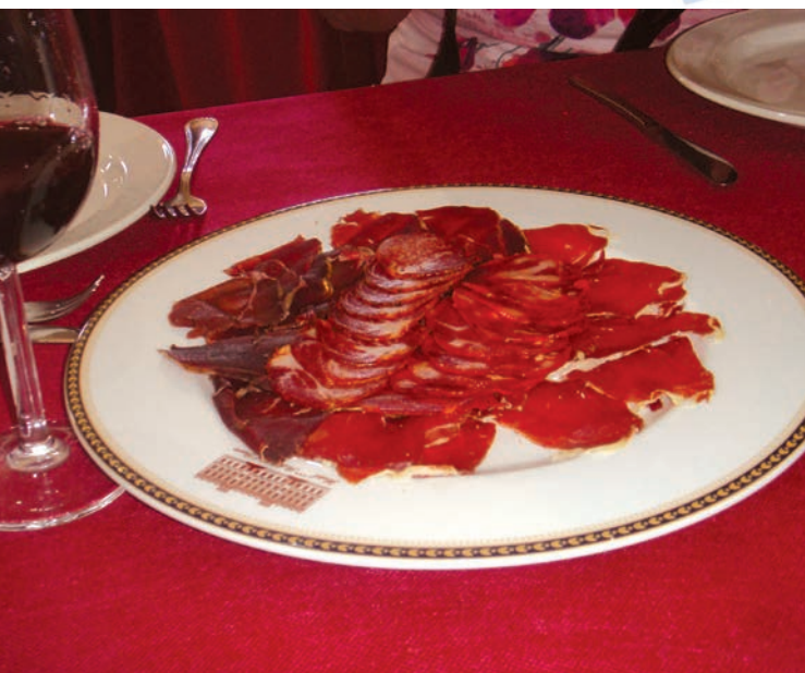
Jamón ibérico de bellota*

Po zjednoczeniu królestw Półwyspu Iberyjskiego w „Corona de Castilla” przez Królów Katolickich: Izabelę Kastylijską i Ferdynanda Aragońskiego i po zakończeniu rekonkwisty rozpoczęła się kastelianozacja chrześcijańskiej Hiszpanii oraz Ameryki, po jej odkryciu przez Kolumba. Język hiszpański narodził się w Kastylii i tam jest niezwykle pielęgnowany. Toteż nie dziwi fakt, że trzeci Międzynarodowy Kongres Języka Hiszpańskiego zorganizowano właśnie tam. Kongres odbył się w czerwcu 2013 r. w historycznych aulach uniwersytetu w Salamance.