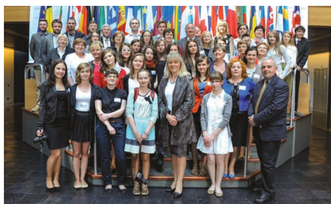
Wizyta w Parlamencie Europejskim w Strasburgu na zaproszenie europosłanki Lidii Geringer de Oedenberg