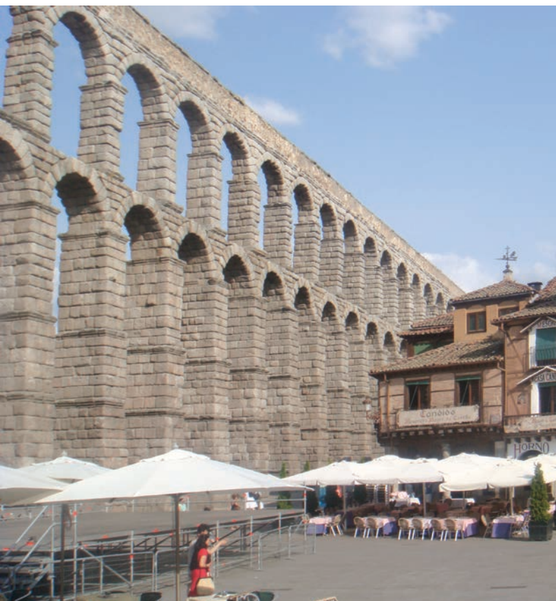
Akwedukt w Segowii