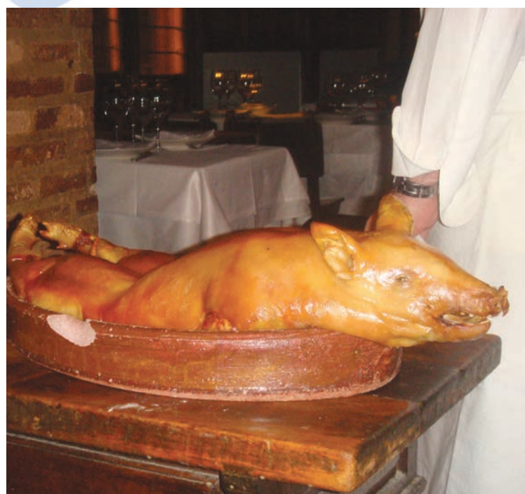
Cochinillo (pieczony prosiak)