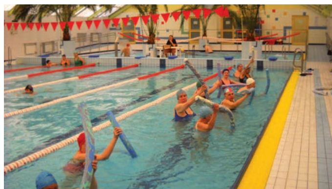
Ulubione zajęcia sportowe