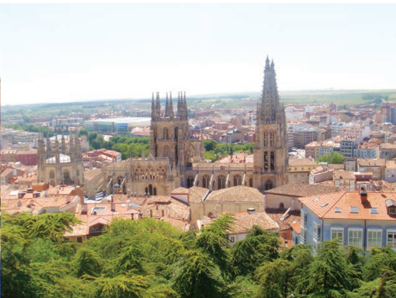
Widok na Burgos

Nazwa regionu pochodzi od słowa castillo – zamek. Po raz pierwszy nazwa Kastylii pojawia się w dokumencie z roku 800. Liczne zamki i fortyfikacje w Kastylii służyły obronie tej krainy przed muzułmańskimi najeźdźcami z południa. Jeden z najpiękniejszych zamków znajduje się w Peñafiel. Jest w nim Muzeum Wina. Przez Kastylię León prowadzi najstarszy pielgrzymi szlak. Wiedzie pielgrzymów do grobu świętego Jakuba w Santiago de Compostela. Na szlaku wzniesiono arcydzieła architektury romańskiej i średniowiecznej, na przykład gotycka katedra w León ze wspaniałymi witrażami czy równie wspaniała katedra w Burgos zdobiona ażurowym maswerkem.