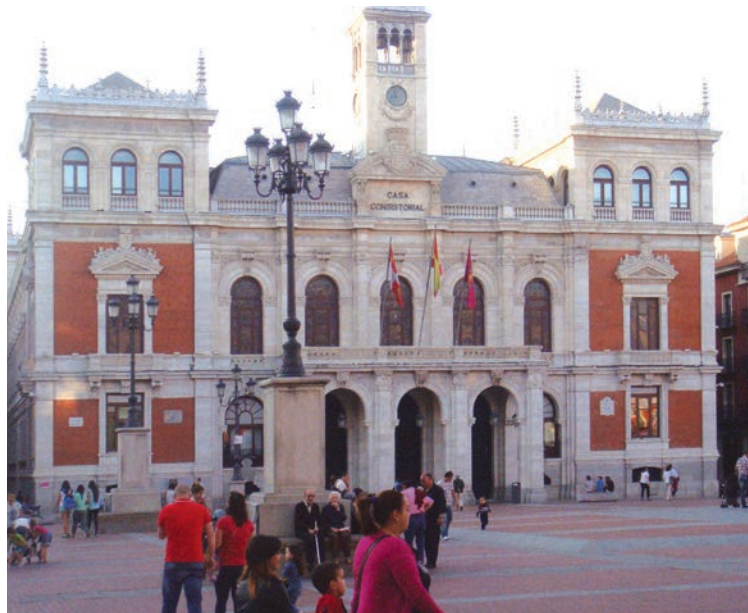
Ratusz w Valladolid

Warto uczyć się kastylijskiego w Kastylii León, ponieważ jest kolebką języka hiszpańskiego, ponieważ szkoły i uniwersytety oferują konkurencyjne ceny w porównaniu