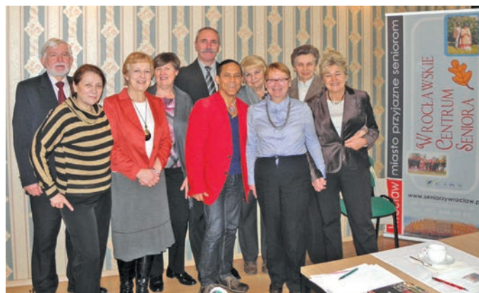
Spotkanie przewodniczących samorządów słuchaczy UTW we Wrocławskim Centrum Seniora