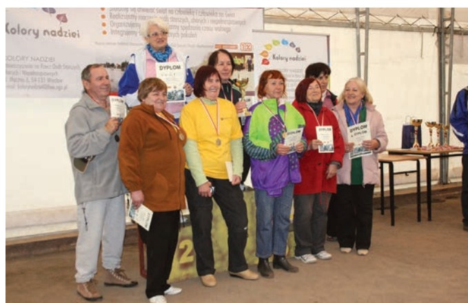
Zwycięska drużyna na Turnieju Integrycyjnym w bule, w Jedlinie Zdroju