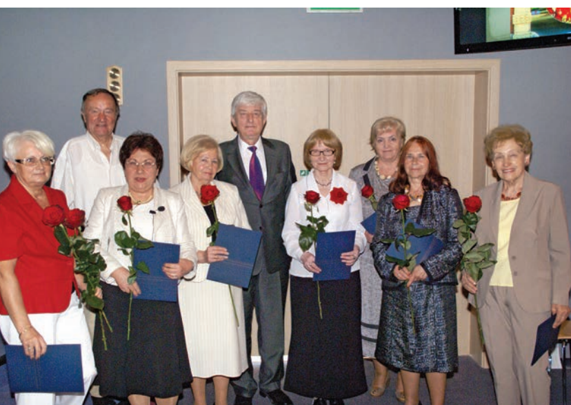
Słuchacze UTW wyróżnieni przez JM Rektora