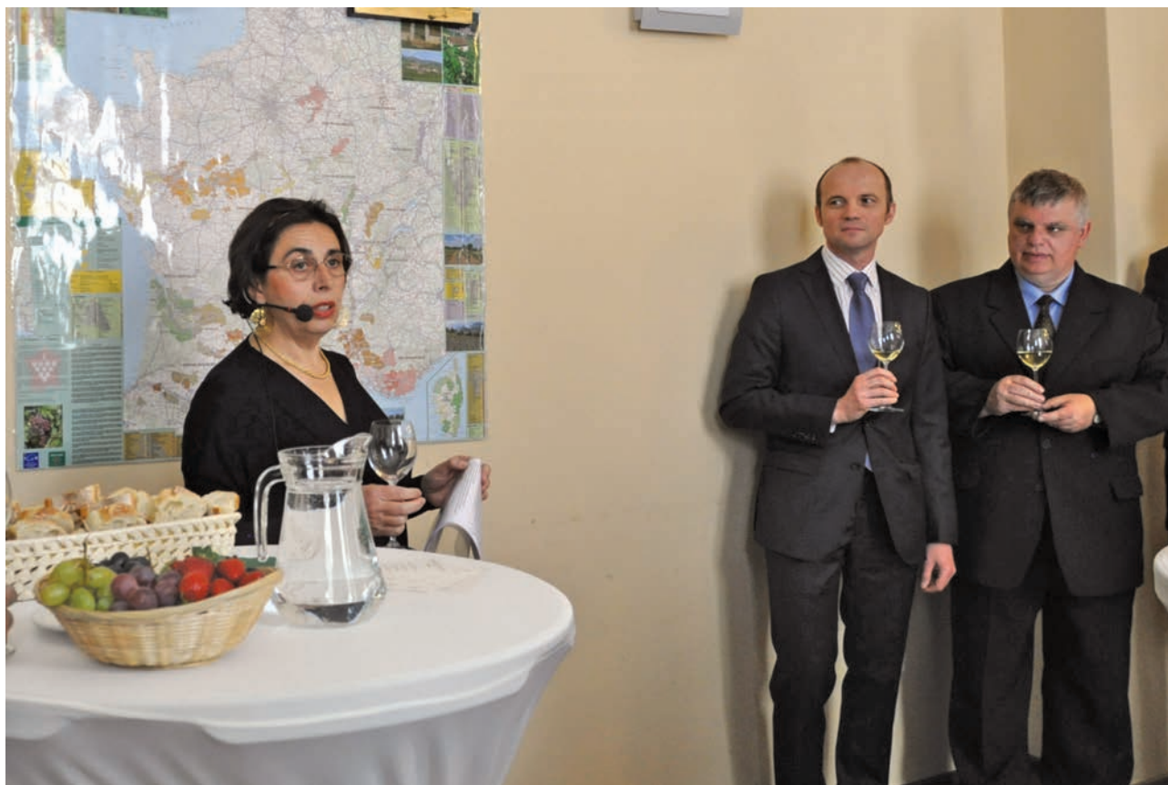
Dzień Otwarty Credit Agricole na UE

Mieszkańcy Wrocławia bardzo się zmienili. Dawniej w sklepie sprzedawcy nie zawsze byli uprzejmi, dzisiaj bardzo się starają zadowolić klientów.