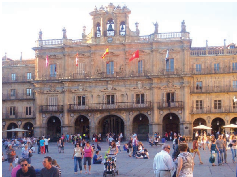
Plaza Mayor w Salamance

Uczestniczyli w nim przedstawiciele kultury Hiszpanii, intelektualiści, pisarze, tłumacze oraz nauczyciele języka hiszpańskiego. Bardzo licznie przybyli Amerykanie, wśród których język hiszpański jest bardzo popularny, a jego znajomość jest wręcz konieczna w dzisiejszej sytuacji społeczno-politycznej. Zaskakująca duża była grupa hispanistów z Azji: Chin, Korei. Ta międzynarodowa konferencja odbyła się pod bardzo znaczącym tytułem El global español (globalny język hiszpański).