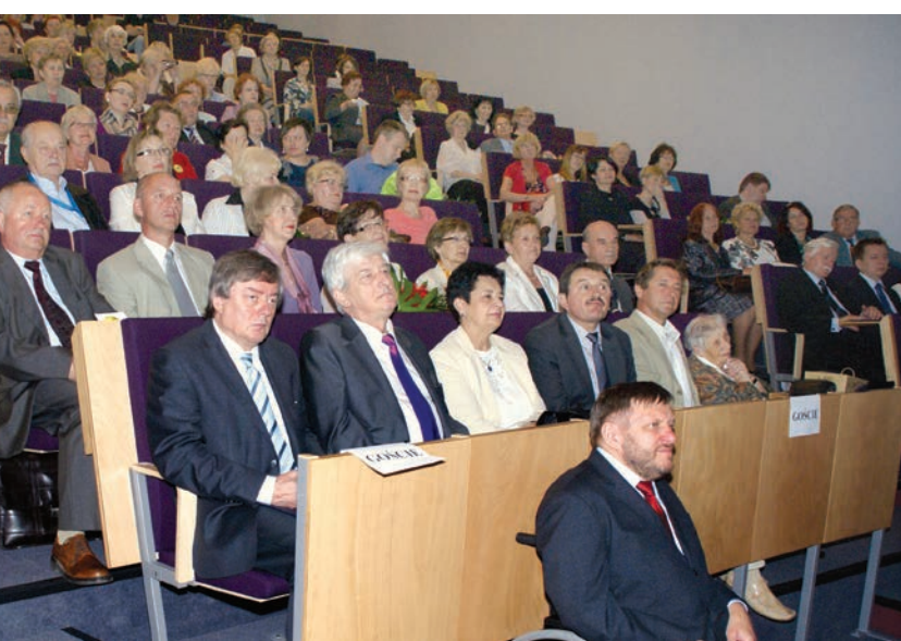
Przedstawiciele władz Wrocławia, UMWD, uczelni oraz zaprzyjaźnionych UTW podczas uroczystości jubileuszu 5-lecia UTW