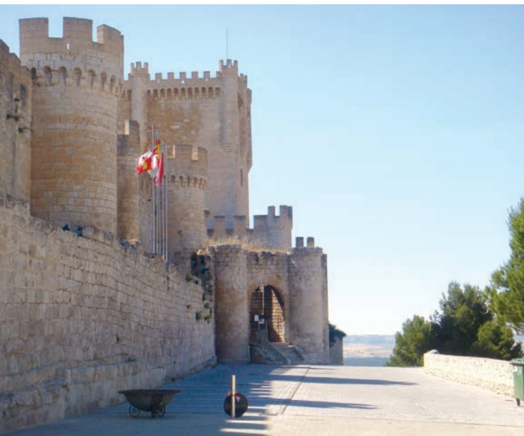
Zamek w Penafiel