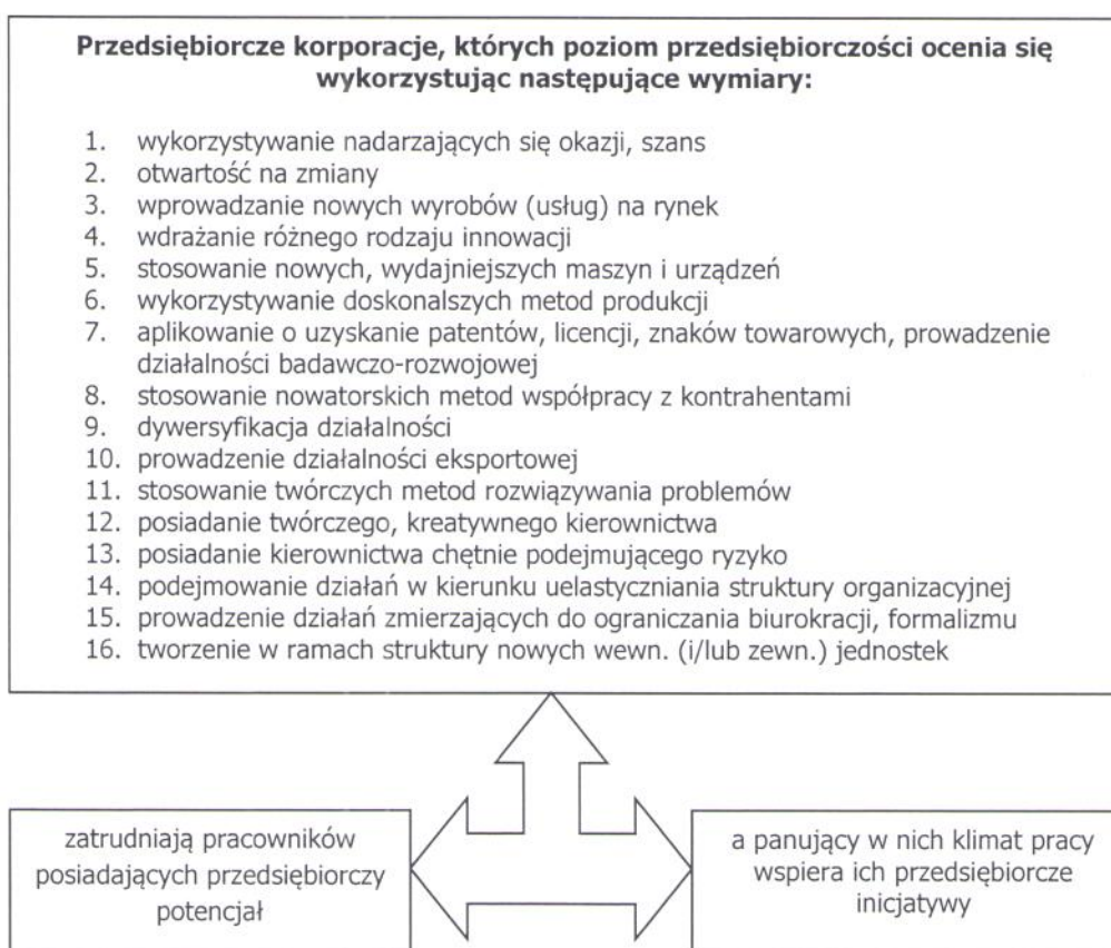
Rys. 1. Teoretyczny model rozwoju przedsiębiorczości w korporacjach

przedsiębiorczych inicjatyw. W procesie badawczym zastosowano także wywiady pogłębione, które przeprowadzono wyłącznie z kierownikami. Zrealizowano 10 indywidualnych wywiadów opartych na kwestionariuszach ankiety, choć zadawano także pytania dodatkowe, które ułatwiały poznanie specyfiki pracy w korporacjach, panujących w nich relacji, itp. Wpływało to na lepsze zrozumienie złożoności uwarunkowań (także powiązań, interakcji) mających miejsce w korporacjach, a wpływających na rozwój w nich przedsiębiorczości. Badania pozwoliły ocenić: (1) poziom przedsiębiorczości korporacji (wykorzystano do tego 16 autorskich wymiarów); (2) przedsiębiorcze predyspozycje pracowników wykonawczych (wykorzystano do tego opracowany przez G. Pinchota test dla intraprzedsiebiorców, zawierający 11 pytań); (3) klimatu pracy (wykorzystano w tym celu 12 autorskich pytań odnoszących się m.in. do stosunku przełożonych do inicjatyw podwładnych, do eksperymentowania, podejmowania ryzyka, itp.).